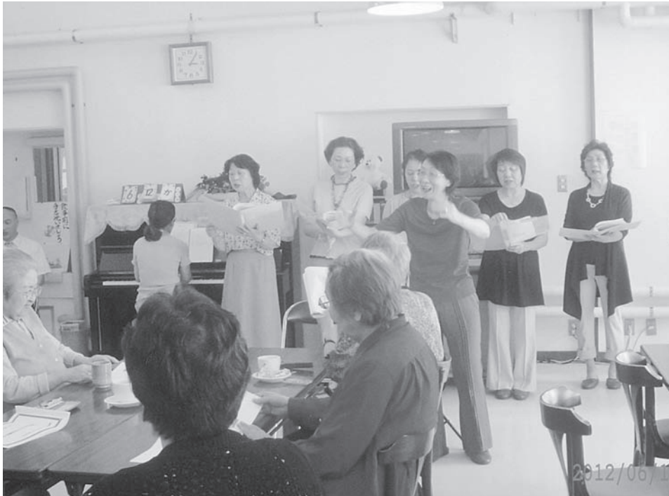
～四季を歌う会との交流会（だいせんにて）～