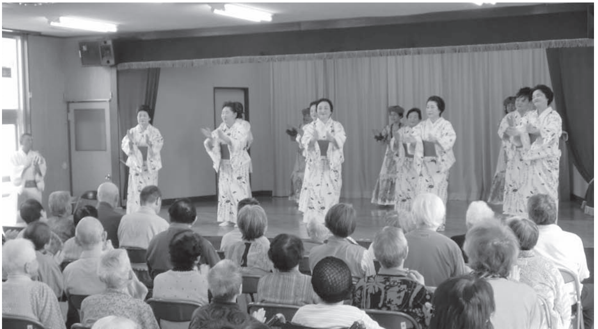
～桜雅会の慰問（松寿会機能回復訓練室にて）～