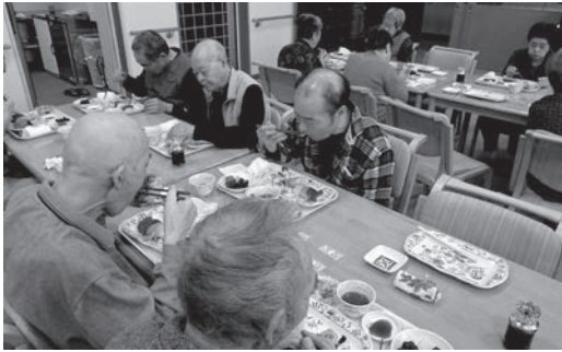
～おいしくてはしも進みます～