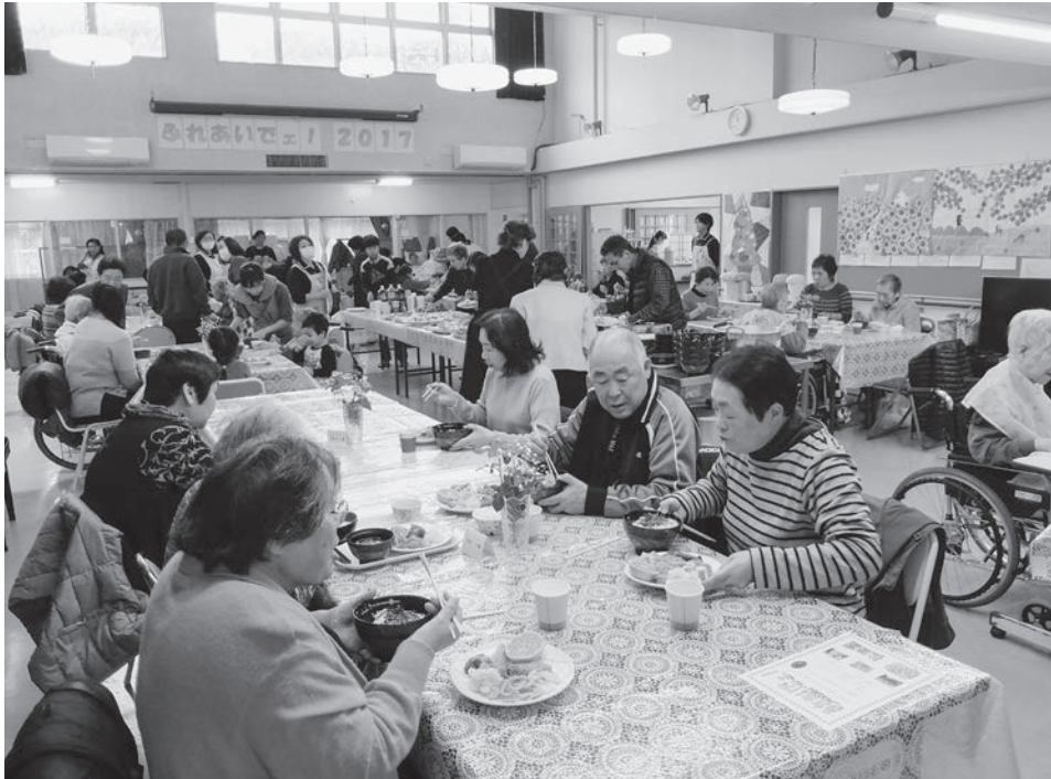
～家族団らんの時間で話しが弾みます～