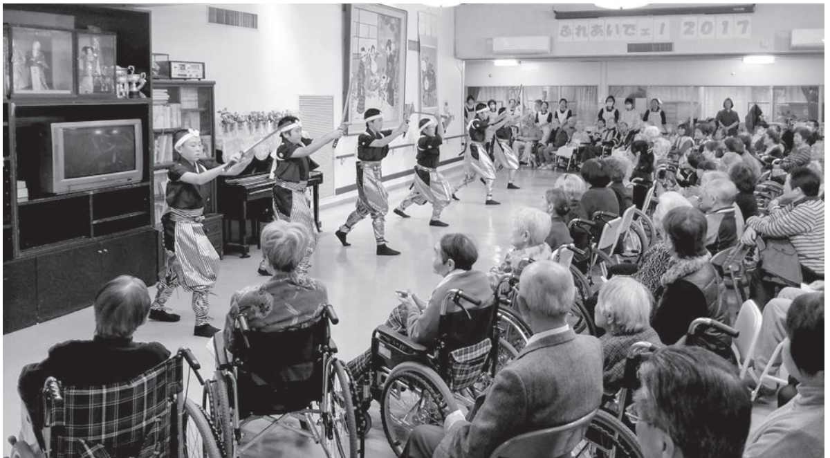
～迫力ある演武を披露していただきました～