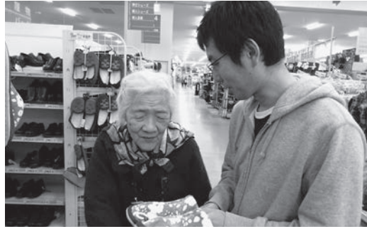
～ショッピングレクリエーション(松峰園)～