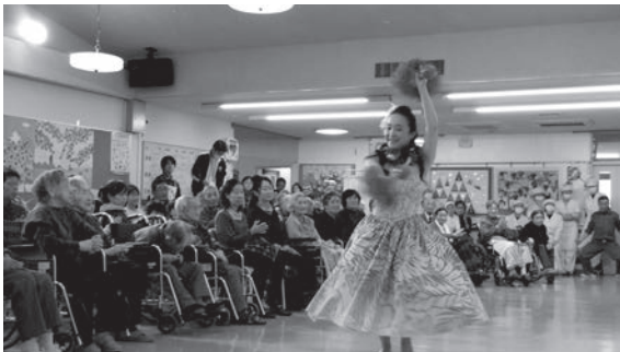
～華麗な踊りで会場が盛り上がりました～