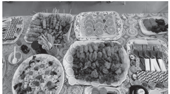
～たくさんのごちそうが並びました～