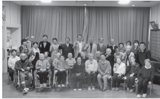
～黒ちゃんの会慰問(デイサービスセンター)～