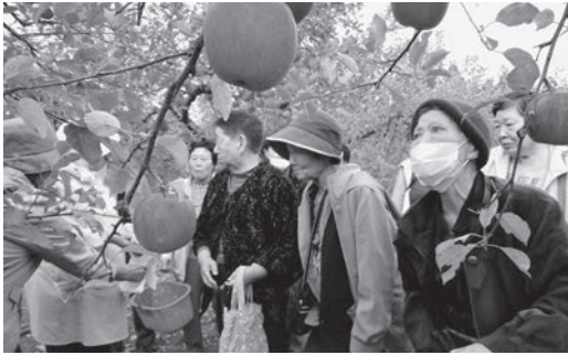
～りんご狩り(だいせん)～