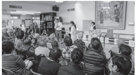
～当たるといいなあ… 大抽選会～