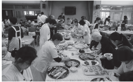
～どれにしようかな～