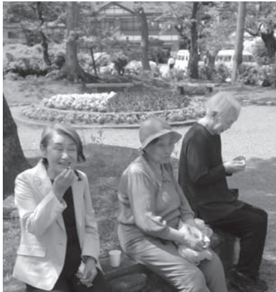
～ツツジを見ながら～