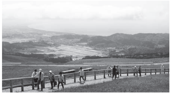
～回転展望台までは歩いて登ります～

五月二十四日、だい せんで「春のレクリ エーション」として男 鹿市の寒風山までドラ イブが行われました。