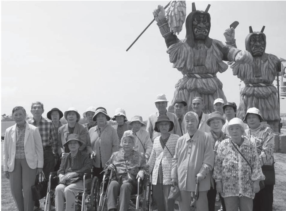
～だいせん利用者のみなさん（男鹿総合観光案内所にて）～