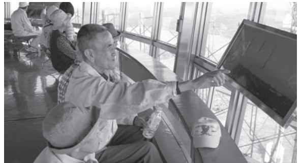
～「大潟村の干拓地は向こうだな」～