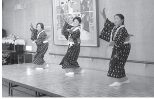
～沖田町民謡クラブの皆さんによる慰問～