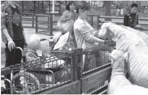
～大森山動物園レク～