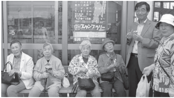
～ブルーメッセあきたにて～