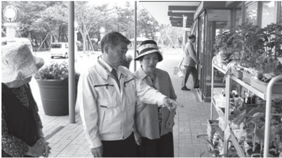
～途中、道の駅てんのうでお買い物～