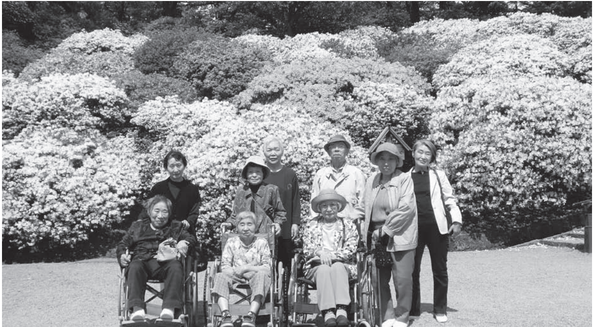
～松寿園ツツジレクリエーション（千秋公園にて）～