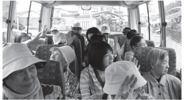
～みなさん、元気に出発しました～