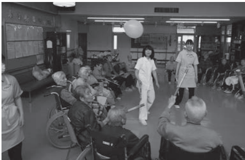
～風船と棒をつかったゲーム（松涛園）～