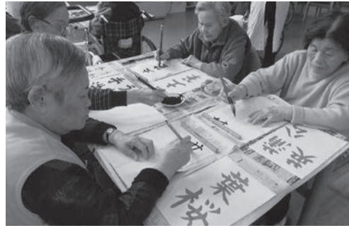
～書道クラブ（松寿園）～