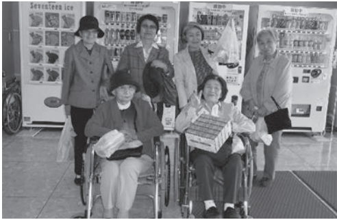
～ショッピングを楽しみました～