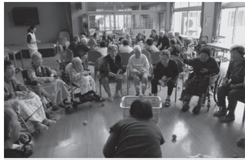
～びんびんデー体育の日（松寿園）～