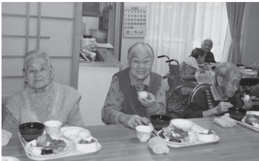
～たくさんのごちそうが並びました～