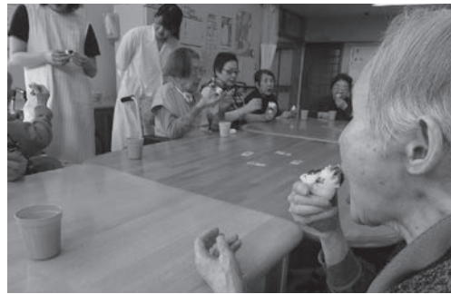
～おいしくて大満足～