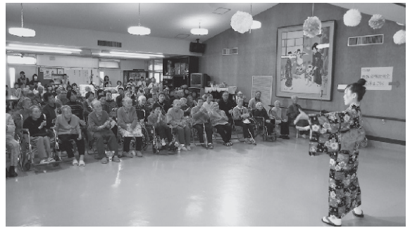
～華麗なおどりが会場を盛り上げる～