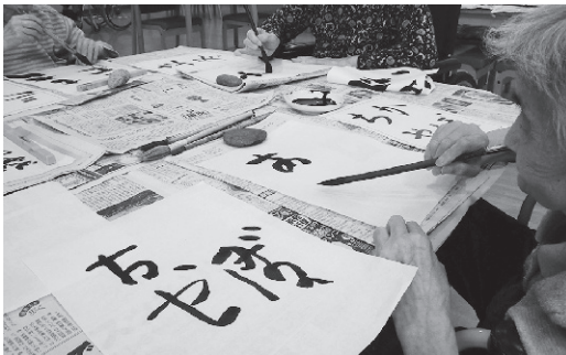
～書道クラブ(松寿園)～