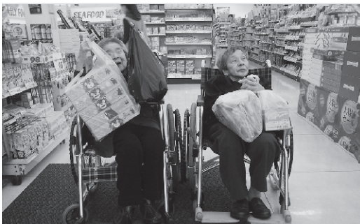
～買い物を楽しみました(松峰園)～