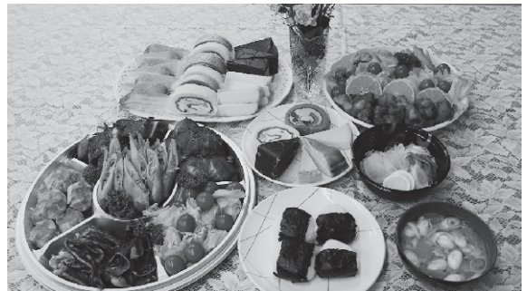
～たくさんのごちそうがらぶ～