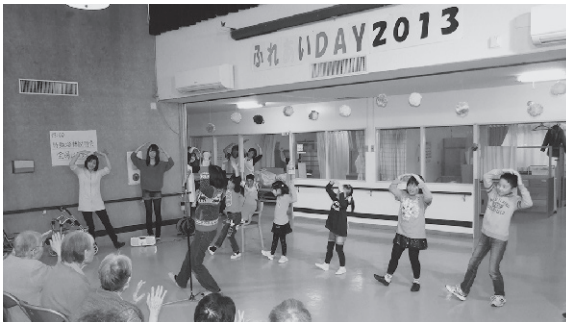
～交流を楽しみました～