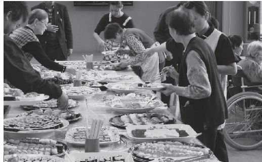
～好みの寿司をえらびながら～