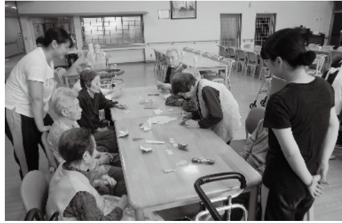
～日赤短大生との交流会（松寿園）～