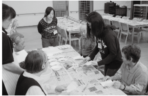
～美術大学生と創作クラブ（松寿園）～