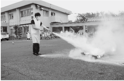
～合同避難訓練（松寿園・松峰園）～