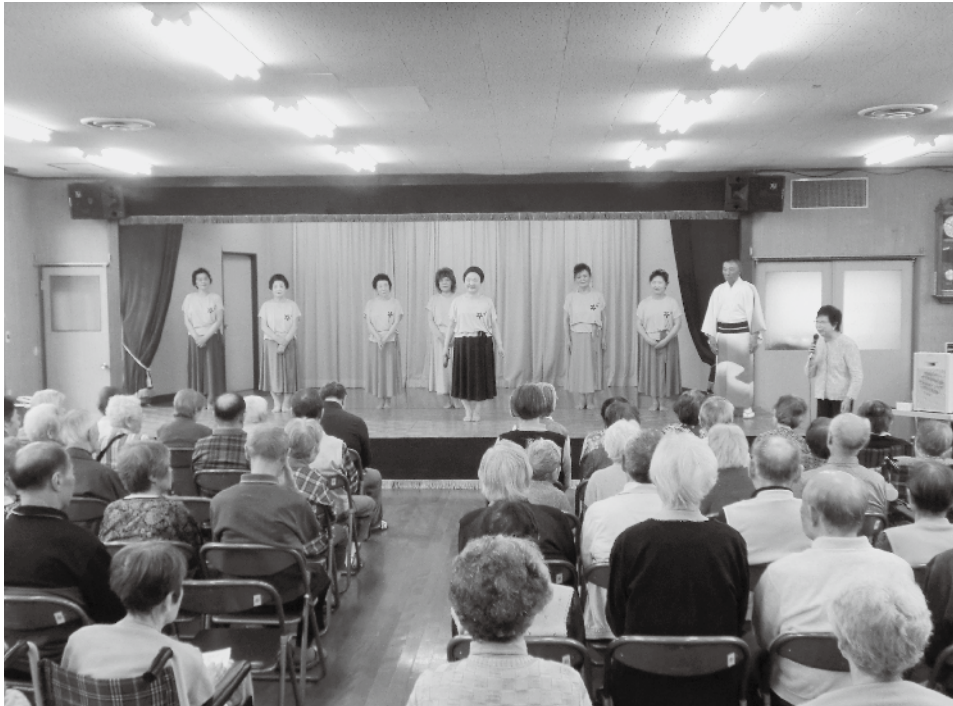
～桜雅会の慰問（機能回復訓練室にて）～