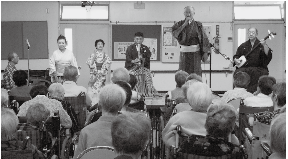
～久保田民謡同行会の慰問（松涛園ホールにて）～