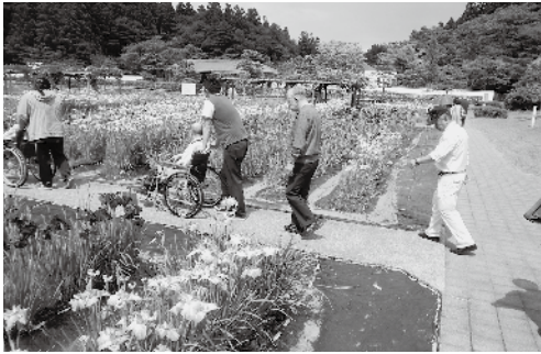
～野外レク花菖蒲見物（松寿園）～