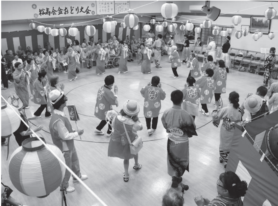
～おどりの輪が広がる～