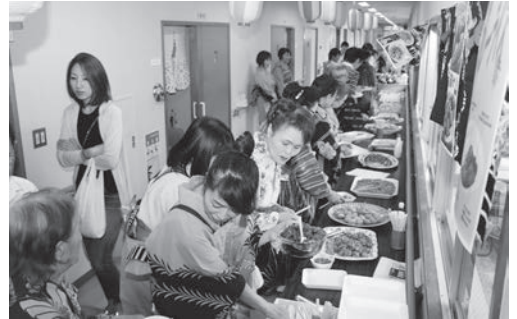
～大盛況の喜多我夜店～

恒例の喜多我夜店（模倣店）が開店すると、待ちわびていた皆さんは早速列になつて料理をお皿に取り分けていきました。全品無料で料理の種類や夜店の数も例年通り開店し、喜多我夜店は大賑わいとなりました。午後七時から盆おどり大会