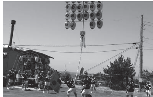
～秋田銀行竿燈会慰問～