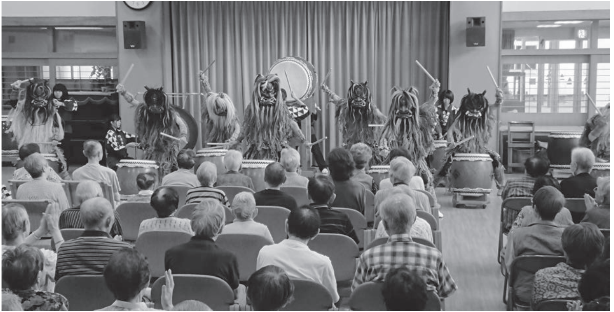
～なまはげの力強い太鼓の音が会場いっぱいに響きわたる～