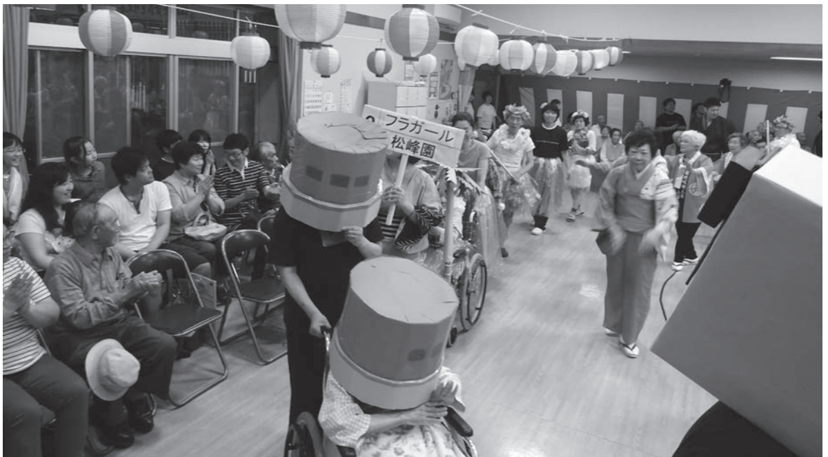
～夏の夜のひとときを楽しむ～