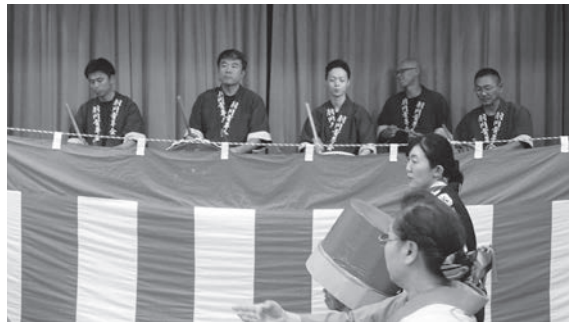
～羽川青年会の太鼓で盛り上げてくれました～

が始まり、最初の曲「北海盆唄」が流れると、ボランティアのまなすグループと桜雅会の皆さんが参加され、おどりの輪が広がりました。また、各施設の利用者及び松涛園の職員が趣向を凝らした仮装お