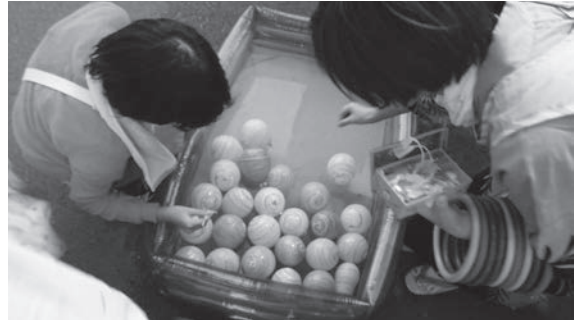
～わなげとヨーヨーすくいは子供たちにも大人気でした～