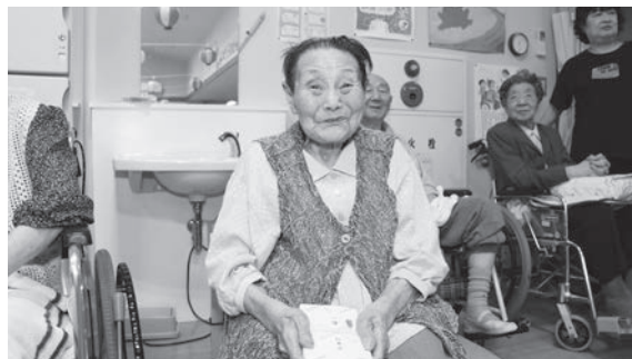
～抽選会で大あたり!!～

終了後の仮装おどりの表彰式では、各賞の発表ごとに会場からの歓声と拍手の中、各施設のチーム同士で喜び合う光景がみられるなど、盛会裏のうちに大会の幕を閉じました。