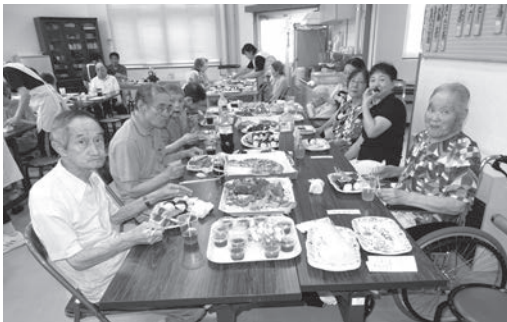
～夏のランチ (松峰園) ～