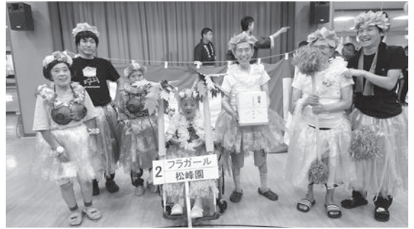
～仮装大賞 フラガール (松峰園) ～