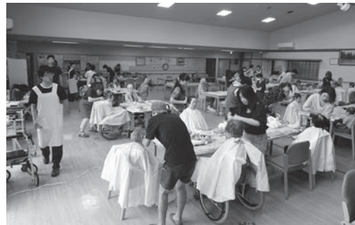
～パーマ・カット慰問～