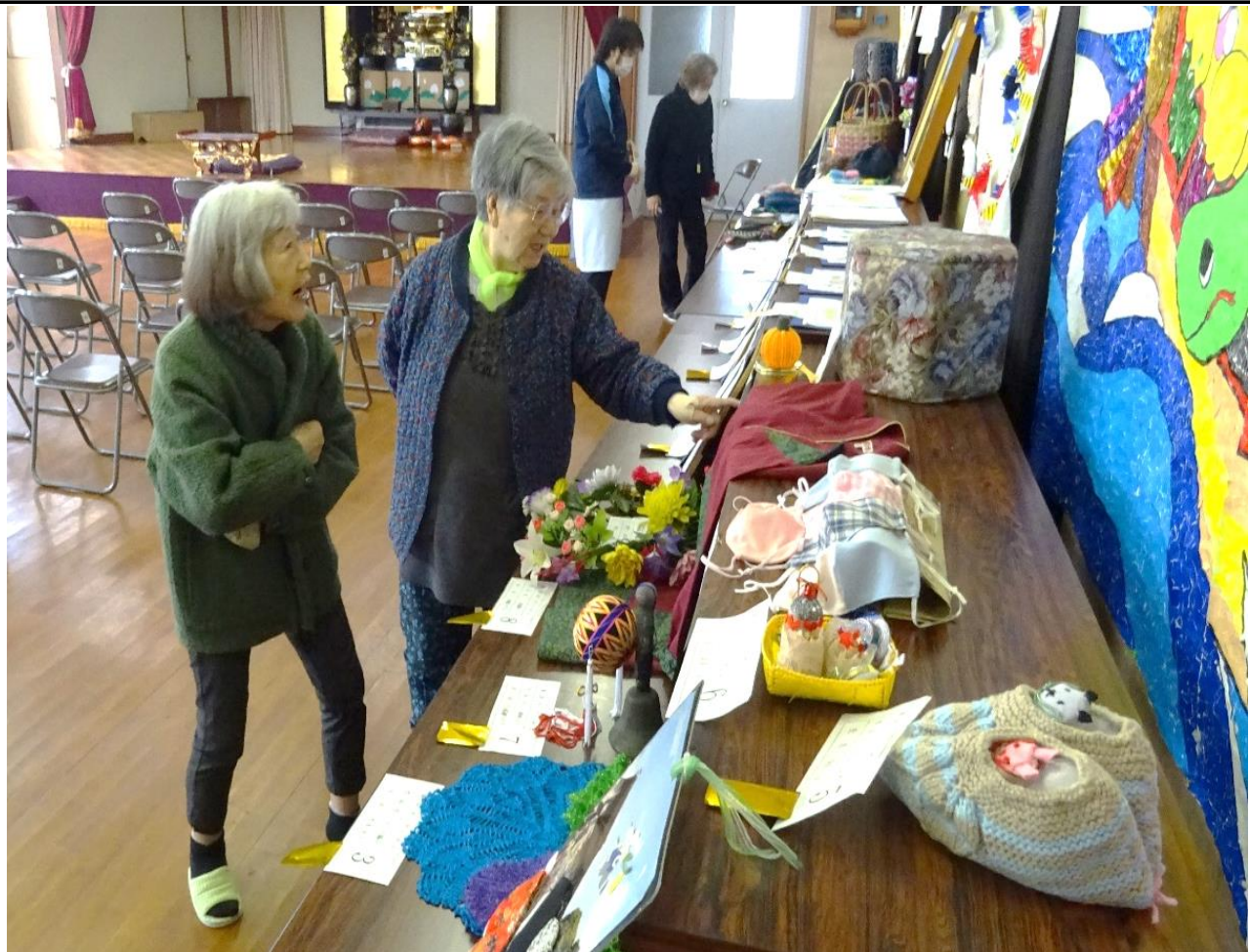
～たくさんの作品に利用者の方々も足を止めて見入っていました～