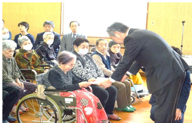
～佐々木常務理事から賞詞が手渡される～