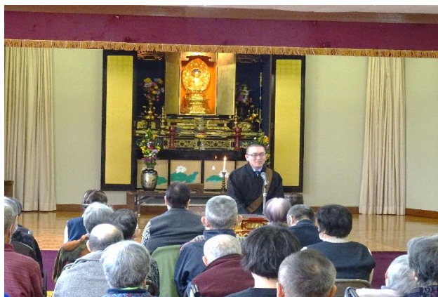
～法話に耳を傾ける～