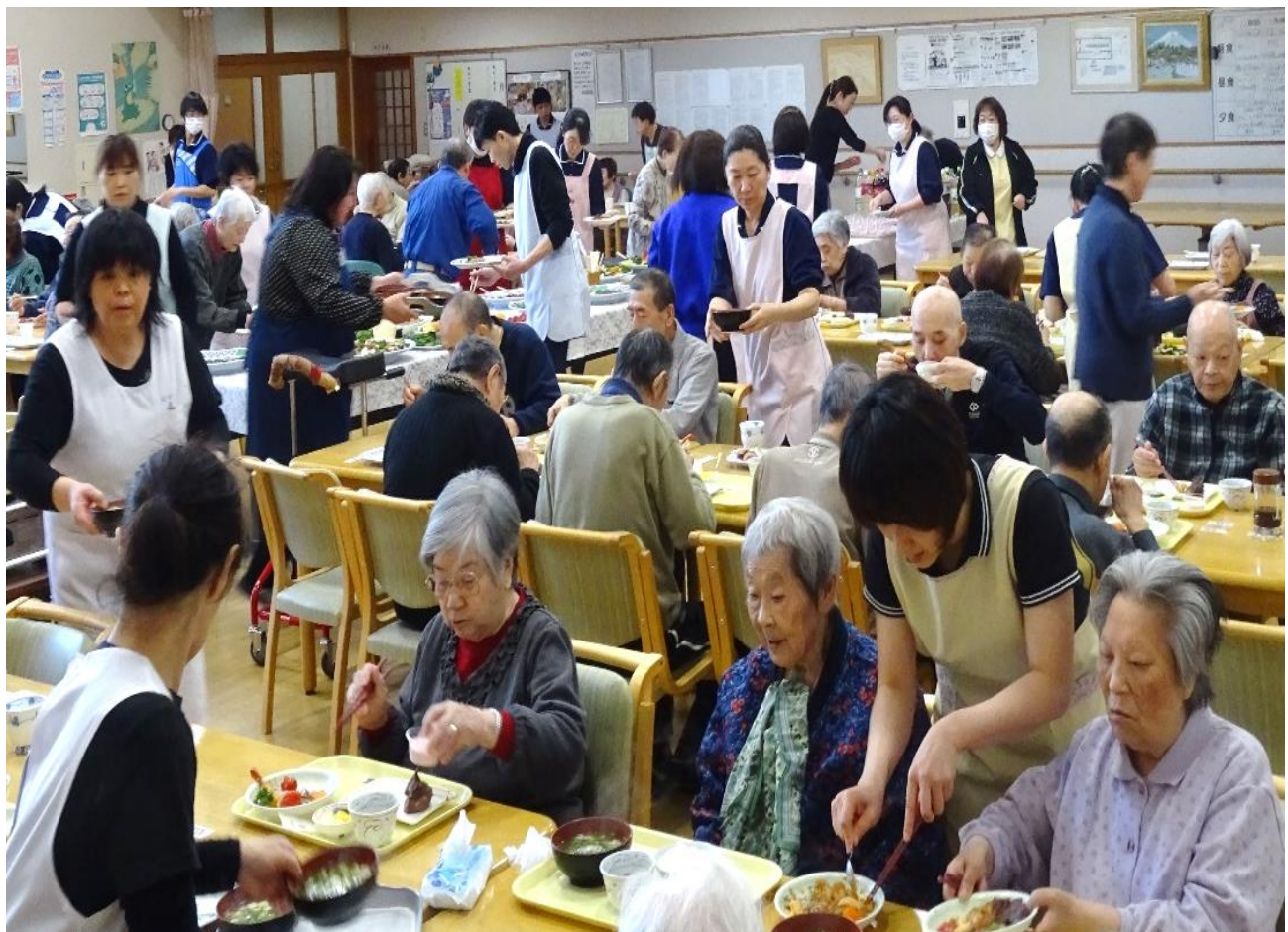
春の行事が行われました