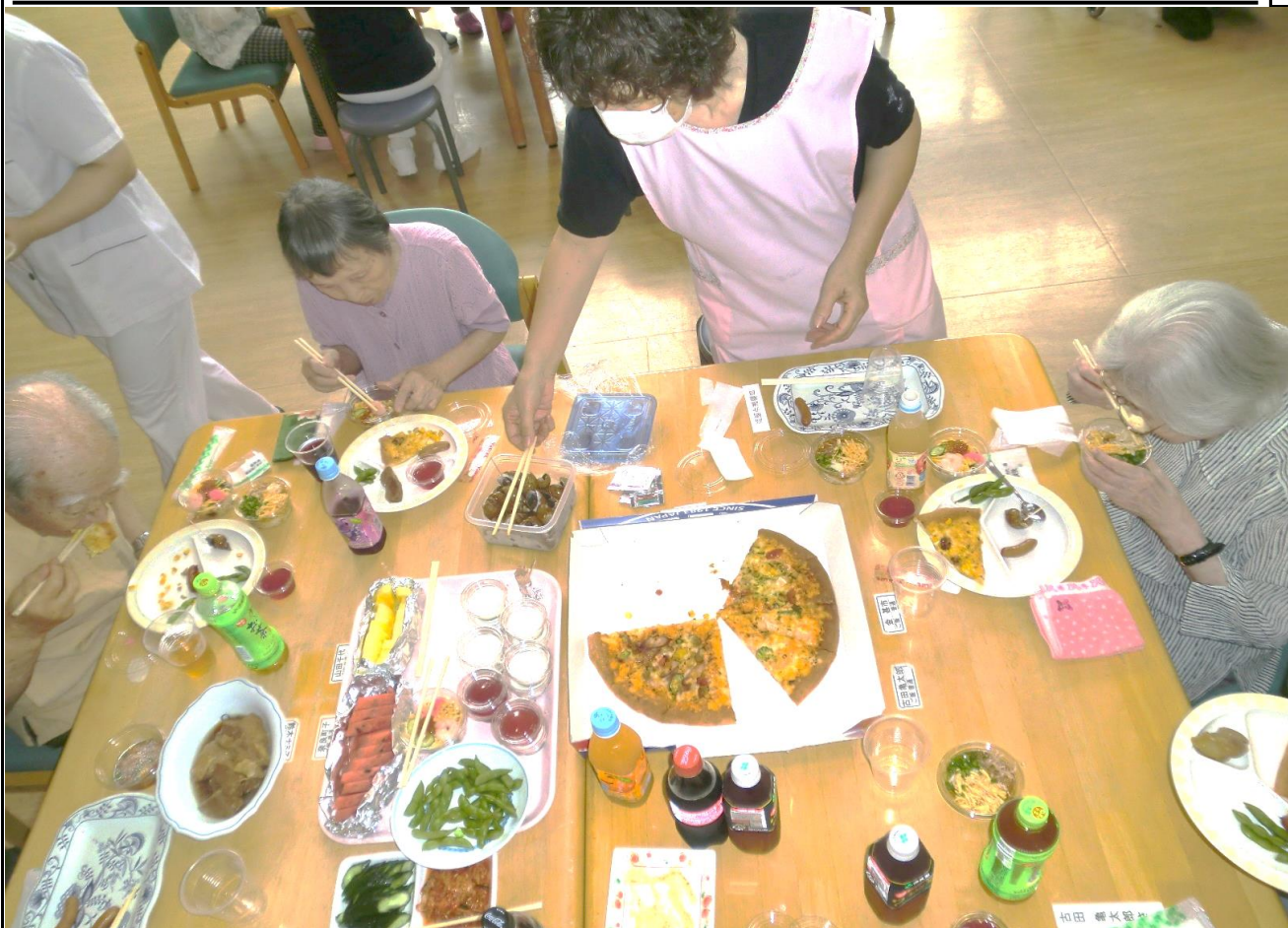
～あっという間に減っていきます～