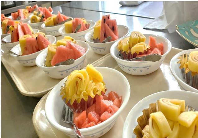
～完成！上手にできました～