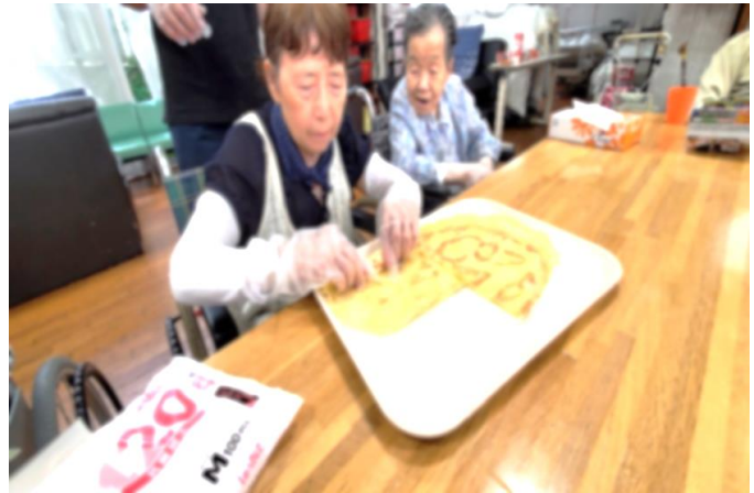
～うまくできるかな～