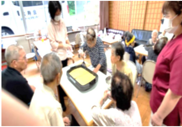
～慣れた手つきでひっくり返します～