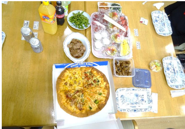
～おいしい料理がたくさん並びました～