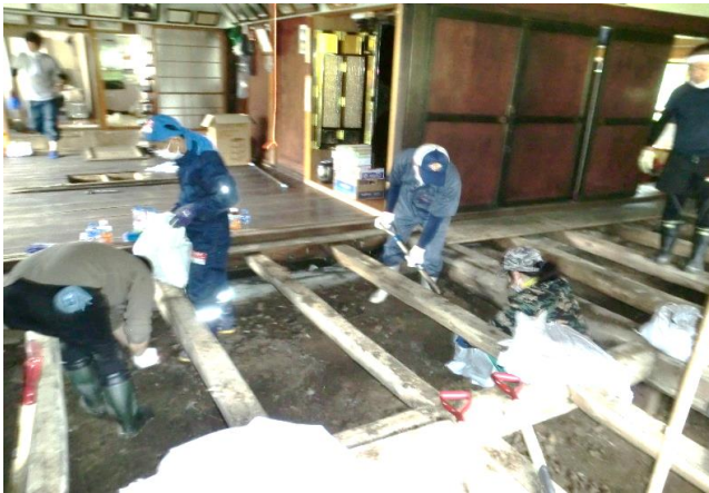
～秋田市下浜地区へ浸水被害に伴うボランティア活動を行いました～