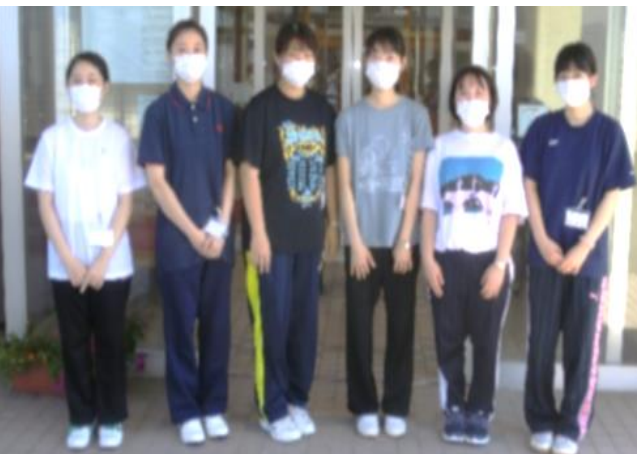
～日本赤十字秋田看護大学生実習～