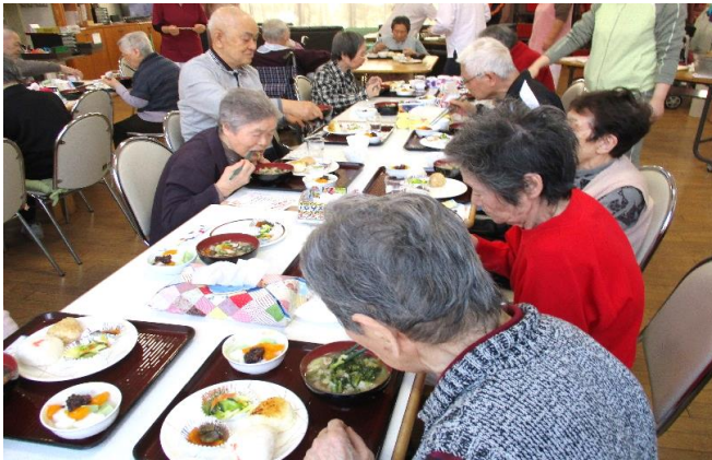
～おいしくてはしも進みます～