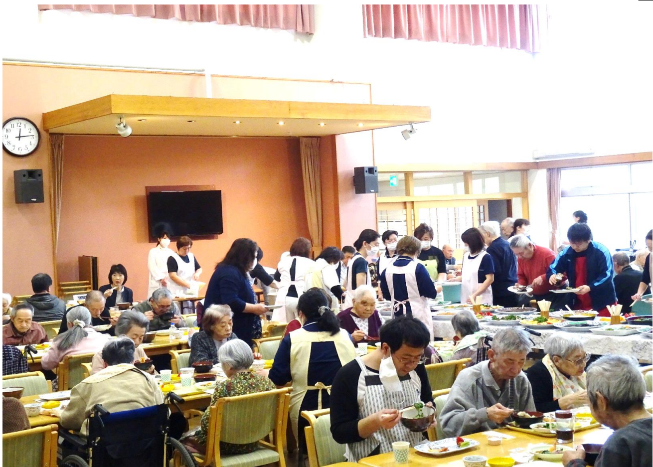
春の行事が行われました