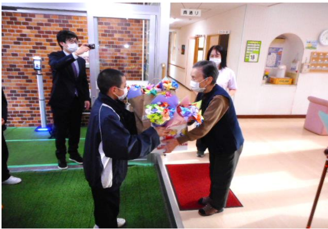
～秋田西中の生徒さんから手作りの花をたくさんいただきました(だいせん)～