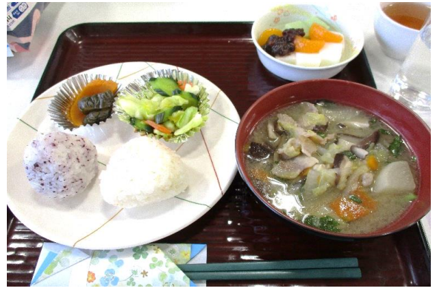
～おにぎり会食献立～