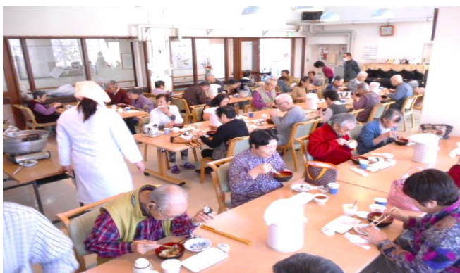
～おいしい料理に舌つづみ～