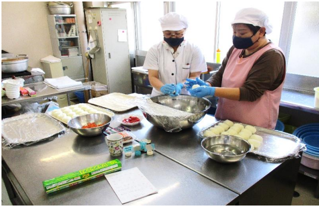
～調理員の握る手にも力が入ります～