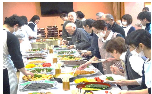
～どれにしようか悩みます～