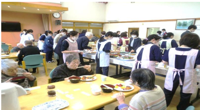
～みんなでおいしくいただきました～