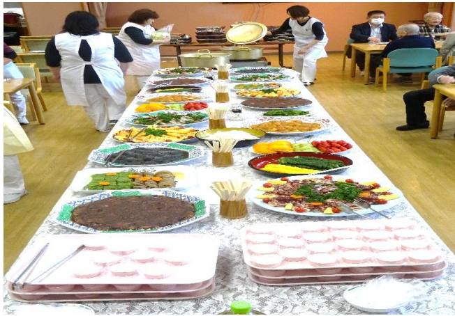
～たくさんのごちそうが並びました～